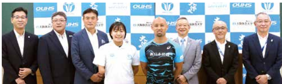
東京パラリンピック 大阪体育大学関係選手社行会