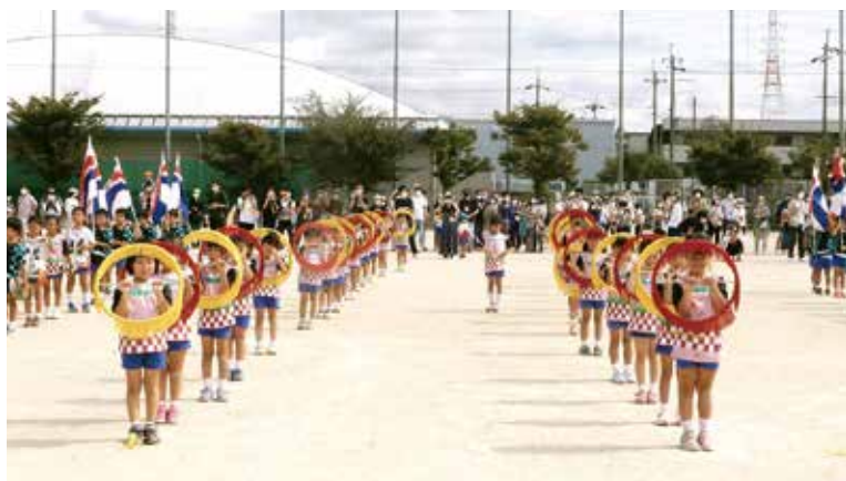
3学年合同の運動会を東雲グラウンドで実施

幼稚園まつりでは「東京五輪」をテーマに、3学年合同でお遊戯室に展示を行いました。まつ組が作成した紙工作の「ドローン」を合体させ、5体のブルーインパルスが頭上を飾りました。新型コロナウイルス感染症にも負けず、お餅つき、クリスマス会等の大きな園行事も無事に執り行うことができました。