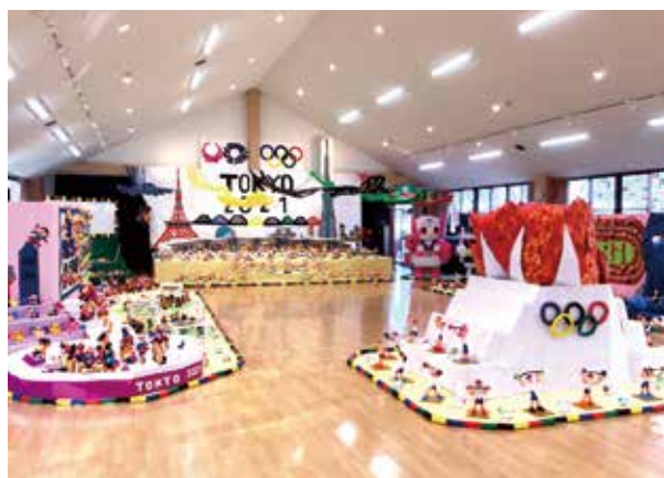
幼稚園まつりでは、「東京五輪」をテーマに作品を展示