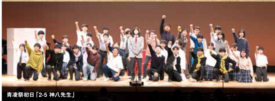
青凌祭初日「2-5 神八先生」