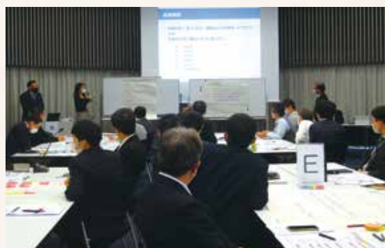
ワークショップ後の成果発表