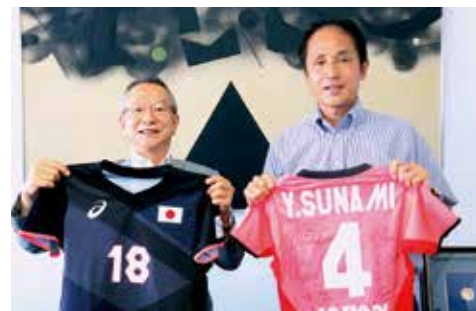
ハンド女子日本代表ユニホームを寄贈いただきました