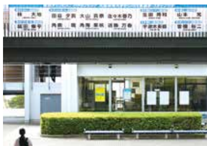
本学のオリンピック・パラリンピック代表選手・スタッフを紹介する横断幕