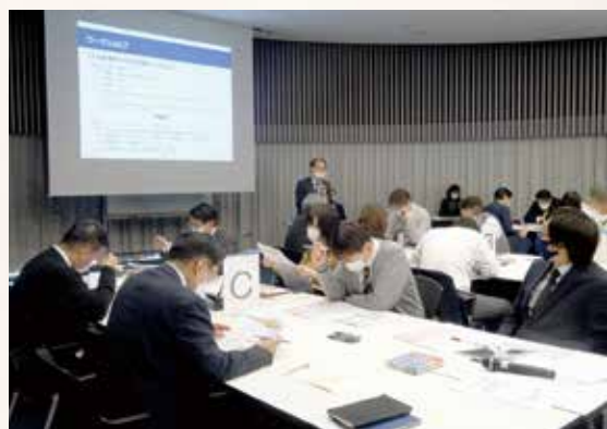
事務職員対象「職員業務の構造改革研修会」